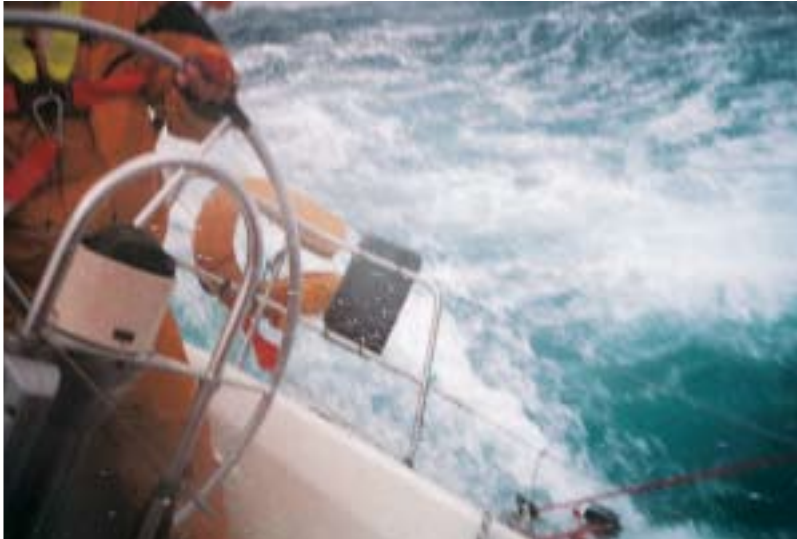
Die Sicht ist durch waagrecht wehende Gischt und ständig brechende Seen gleich Null. Die Crew der „Avanti“ völlig erschöpft, aber gesund im Hafen von Hobart.